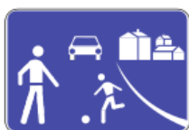
H46 - Zona residencial ou de coexistência.